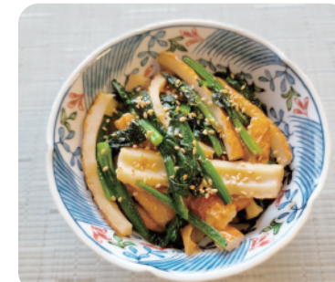
事務のYYさんが作ってみました！